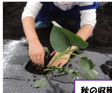
秋の収穫が楽しみだね。