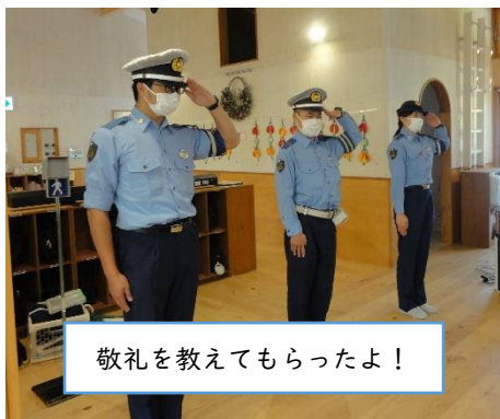
敬礼を教えてもらったよ！

神奈川県警交通安全教育隊と津久井警察署に依頼をして「交通安全教室」を開催しました。ライオンの「ガオガオくん」と一緒に大切な命を守るための約束をしました。